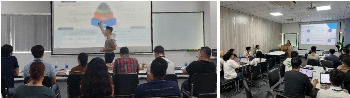
Hình 1. Phương pháp trình bày nghe nhìn (Audiovisual Techniques) trong đào tạo nội bộ tại doanh nghiệp

Cùng với phương pháp thuyết giảng, người thực hiện đào tạo sử dụng phương pháp này với các hình ảnh minh họa, slide trình chiếu hay video để truyền đạt kiến thức trong quá trình đào tạo. Đặc biệt việc sử dụng video là một phương pháp giảng dạy ngày càng trở nên phổ biến, mang lại sự đa dạng và tính tương tác cao cho quá trình học [19]. Phương pháp này được sử dụng để cải thiện kỹ năng giao tiếp, kỹ năng phỏng vấn, kỹ năng dịch vụ khách hàng, ngoài ra nó còn giúp minh họa các thao tác trong một quy trình (ví dụ: quy trình hàn, hướng dẫn sử dụng thiết bị,...) [5, p. 262]. Phương pháp này chủ yếu thúc đẩy sự thu nhận kiến thức bằng thính giác và thị giác của người học.