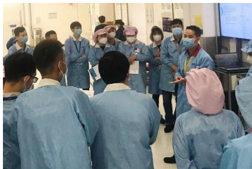
Hình 3. Huấn luyện đội nhóm (Team Training)

Doanh nghiệp sẽ tổ chức các buổi huấn luyện chuyên sâu về kỹ năng làm việc nhóm và lãnh đạo cho các đội nhóm trong từng phòng ban. Nhiều nghiên cứu đã chỉ ra các nhóm được đào tạo hiệu quả có xu hướng phát triển các năng lực giải quyết vấn đề, phối hợp thu thập thông tin và hỗ trợ, cũng như tạo ra một môi trường tin tưởng và hỗ trợ lẫn nhau [28]. Có 3 hoạt động thường dùng trong phương pháp huấn luyện đội nhóm bao gồm: đào tạo chéo giữa các bộ phận, tổ chức đánh giá hiệu suất nhóm, và huấn luyện cho người đứng đầu nhóm để phát triển kỹ năng lãnh đạo. Đào tạo chéo giữa các bộ phận là quá trình đào tạo nhân viên về công việc và quy trình làm việc của các bộ phận khác nhau trong tổ chức. Bằng cách này, nhân viên hiểu rõ hơn về quy trình làm việc của các bộ phận khác, nắm bắt được mối liên hệ giữa các công việc, từ đó tạo ra sự hiểu biết sâu rộng và khả năng làm việc hiệu quả hơn trong