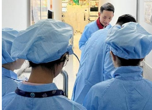
Hình 2. Đào tạo tại chỗ (OJT) tại doanh nghiệp

nghề nghiệp toàn thời gian thường chỉ nhóm đối tượng sinh viên gần tốt nghiệp (năm cuối) sẽ thực tập tại các doanh nghiệp để hoàn tất học phần của mình. Cuối cùng, chương trình đào tạo của doanh nghiệp bao gồm 2 loại hình kể trên lần đầu tạo cho người lao động của họ, diễn ra không chỉ trong giai đoạn “nhập môn” mà còn trong suốt quá trình làm việc, khi có những nhiệm vụ mới cần đào tạo.