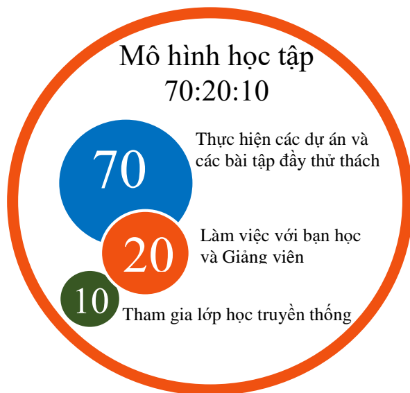
Hình 5. Mô hình lớp học diễn tiến theo tỉ lệ 70:20:10

Các nghiên cứu tại UTE cho thấy có thể áp dụng từng bước mô hình học tập diễn tiến theo tỷ lệ 70:20:10 để phát triển hiệu quả dạy học nhằm hình thành năng lực thực hiện cá nhân.