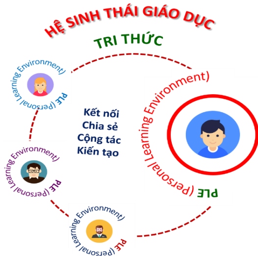
Hình 4. Hệ sinh thái Giáo dục bao gồm các hệ con PLE với khả năng tương tác & tạo dựng tri thức mới