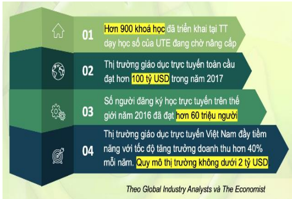
Hình 2. Thống kê thị trường giáo dục trực tuyến