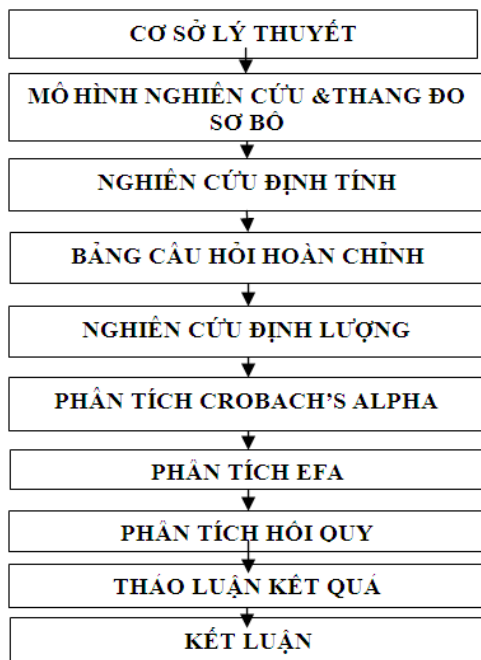
Hình 2. Quy trình nghiên cứu

Quy trình nghiên cứu được thực hiện theo các bước sau: