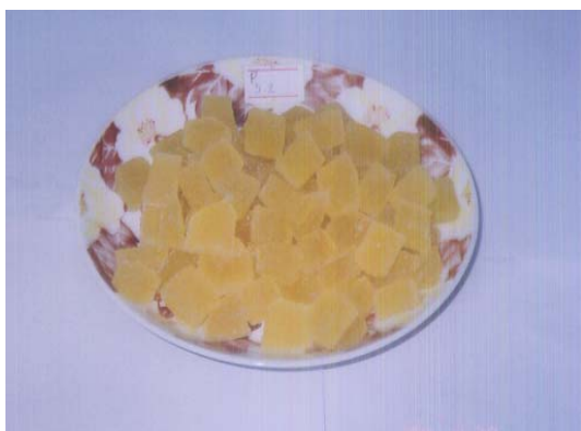
Hình 3: Kẹo dẻo gừng

Sau khi đã xác định được hàm lượng các nguyên liệu thích hợp để tạo cho sản phẩm kẹo dẻo gừng cấu trúc tốt nhất và hương vị đặc trưng nhất, chúng tôi tiến hành đánh giá tổng quát mức chất lượng sản phẩm kẹo dẻo gừng.