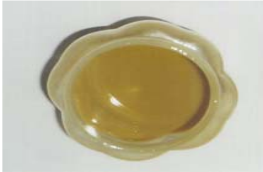
Hình 1: Dịch gừng sau khi cô chân không

Từ những kết quả trên, chúng tôi quyết định chọn nhiệt độ cô chân không dịch gừng là 70°C để thu được dịch gừng có màu vàng đẹp, có vị thơm và có vị cay đặc trưng của gừng với nồng độ chất khô là 45° Brix.